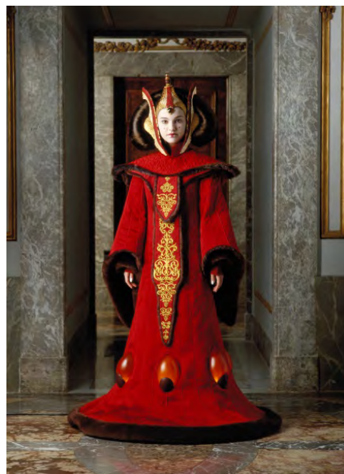
Reina Amidala, traje del Salón del trono. Star Wars™: La amenaza fantasma . © y ™ 2017 Lucasfilm Ltd. Todos los derechos reservados. Utilizado con autorización.

“Muchos de nosotros tenemos gratos recuerdos y una fascinación asociada a las películas de Star Wars y en verdad son los personajes quienes mantienen esta conexión duradera”, afirmó Stefania Van Dyke, especialista interpretativa del DAM. “Personajes tales como Han Solo, la princesa Leia y Luke Skywalker están asociados estrechamente con sus trajes. Esta presentación tan particular ofrecerá una perspectiva sobre la inspiración y los procesos creativos matizados de diseñadores y artesanos”.