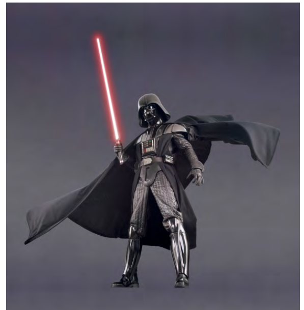
Darth Vader. Star Wars™: El retorno del Jedi . © y ™ 2017 Lucasfilm Ltd. Todos los derechos reservados. Utilizado con autorización.

Lucasfilm, el logotipo de Lucasfilm, STAR WARS y los elementos relacionados constituyen marcas registradas y/o derechos de autor, en los Estados Unidos y en otros países, de Lucasfilm Ltd. y/o sus filiales. TM y © 2017 Lucasfilm Ltd. Todos los derechos reservados. Todas las otras marcas registradas y nombres comerciales son propiedad de sus respectivos dueños.