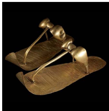
Sandalias de oro de Tut.

(Denver, Colo.) April 2, 2010 –El Denver Art Museum (DAM)(Museo de Arte de Denver) y VISIT DENVER (VISITE DENVER) lanzaron un portal en la Internet y dieron a conocer información relativa a paquetes hoteleros y visitas guiadas para grupos para la muy anticipada exhibición de este verano, Tutankhamun: The Golden King and the Great Pharaohs ( Tutankhamun: El Rey Dorado y los Grandes Faraones ) con más de 100 tesoros provenientes de antiguos sitios egipcios, incluyendo 50 objetos de la tumba del Rey Tut. Esta muestra tendrá su única presentación en el área de las Montañas Rocosas en el DAM a partir del 1 de julio y continuará hasta el 2 de enero del 2011. La exhibición está organizada por la National Geographic Society, el Arts and Exhibitions International y el AEG Exhibitions, con el apoyo del Egyptian Supreme Council of Antiquities (Consejo Supremo de Antigüedades Egipcias). Parte de los fondos que se recauden servirán para auxiliar los esfuerzos para la preservación y conservación de antigüedades en Egipto, incluyendo la construcción de un nuevo gran museo en el Cairo.